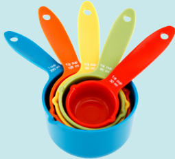
Tazas medidoras (secas), juego