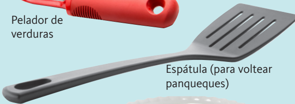
Espátula (para voltear panqueques)