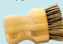
Cepillo para verduras