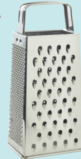
Rallador de cuatro lados