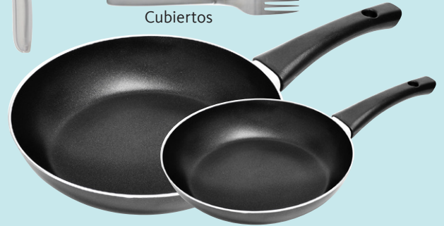
Sarténes, medianos o grandes (eléctricos o aptos para la estufa, tapaderas serían útiles)