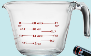
Tazas medidoras (líquido)