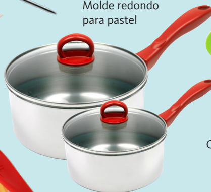
Cacerolas con tapaderas, chica y grande