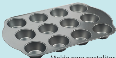
Molde para pastelitos