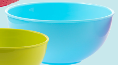
Tazones para mezclar