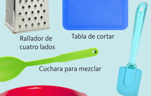
Cuchara para mezclar