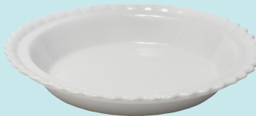
Molde redondo para pastel