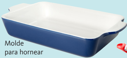
Molde para hornear