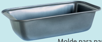
Molde para pan