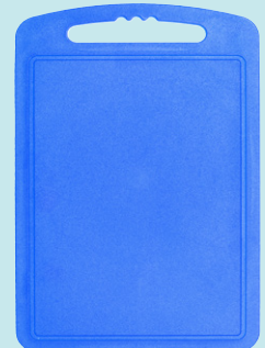
Tabla de cortar