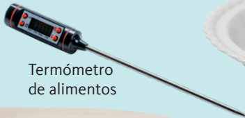
Termómetro de alimentos